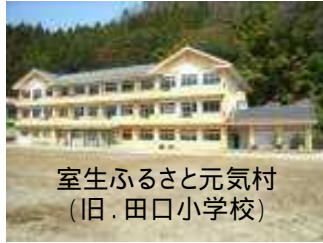
室生ふるさと元気村 (旧・田口小学校)