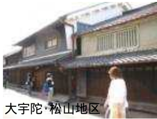
大宇陀・松山地区