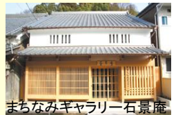
まちなみギャラリー石景庵